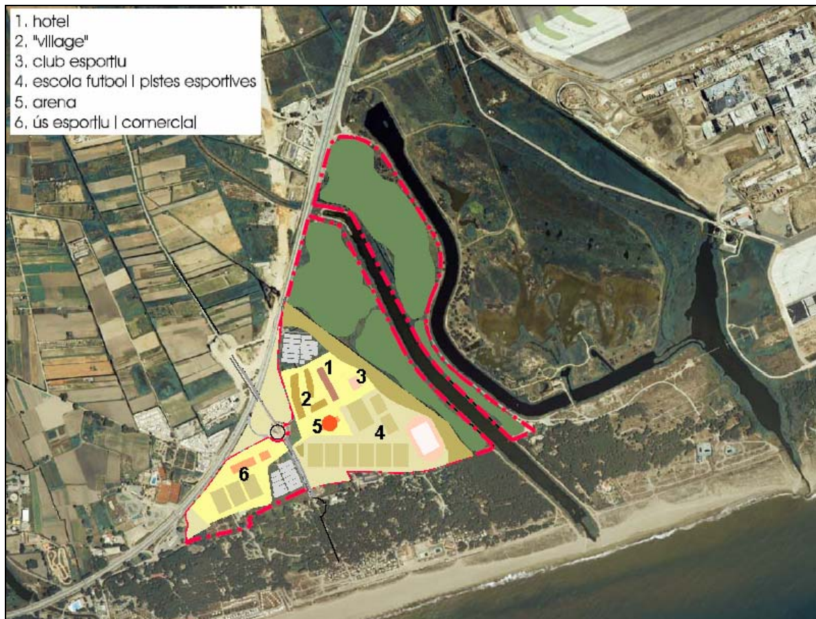
Imatge 5. Proposta indicativa de l'ordenació del sector.

Alhora, es reserva una superfície de 50.224 m 2 per a vialitat i zones d'aparcament en superfície (clau 5); 45.933 m 2 per al sistema d'espais lliures (clau 6c); i els 300.088 m 2 restants es qualifiquen com a sistema de parc forestal de reserva natural (clau 29), atès que corresponen a la fracció de l'àmbit que es troba inclosa dins el PEIN i la Xarxa Natura 2000.