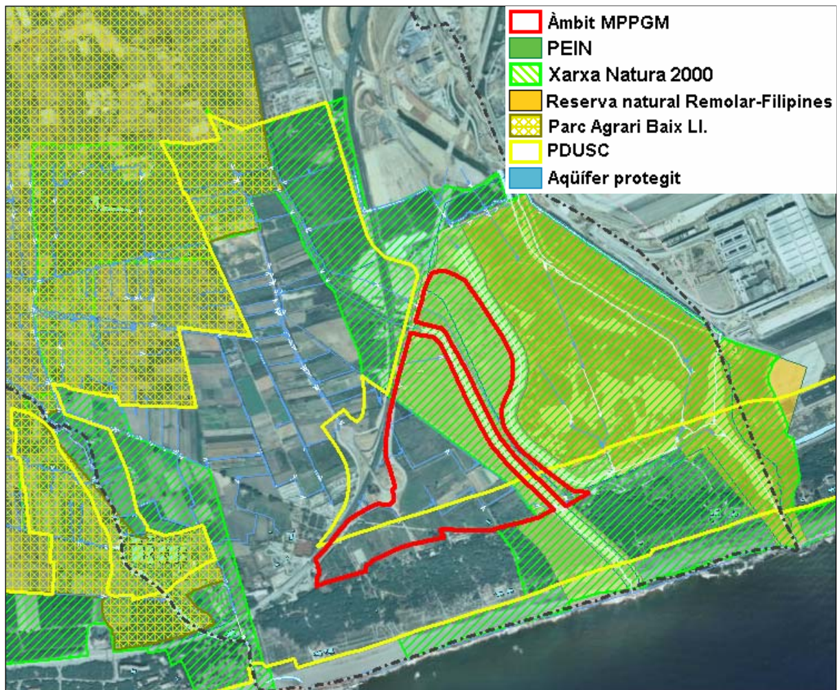
Imatge 1. Identificació dels espais protegits per la legislació sectorial existents a l'entorn de l'àmbit d'actuació de la Modificació puntual

Ahora, cal posar de relleu la proximitat de l'àmbit d'intervenció del Parc Agrari del Baix Llobregat, l'objectiu del qual és preservar i promocionar els usos agrícoles i el seu entorn natural a la Vall Baixa i al Delta del Llobregat, una àrea molt fèrtil i amb un important interès agrícola, cultural i paisatgístic.