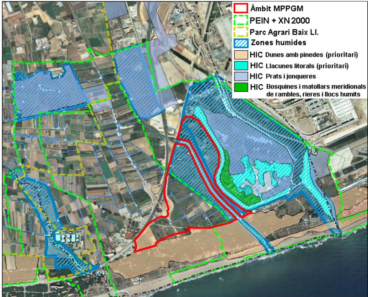
Imatge 2. Identificació de les zones humides i hàbitats d'interès comunitari (HIC) existents a l'entorn de l'àmbit d'actuació de la Modificació puntual.

l'Estany de la Murtra (codi 08001102). Totes elles estan directament connectades amb l'aquífer i en depenen.